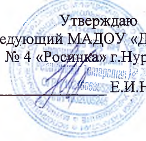
ГРАФИК выдачи пищи с пищеблока

Утверждаю Заведующий МАДОУ «Детский сад № 4 «Росинка» г.Нурлат РТ Е.И.Натарова